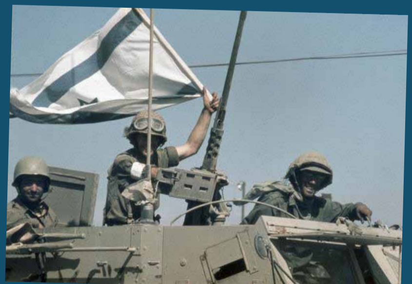
Mehr Erleichterung als Triumph: Israelische Soldaten in Syrien

Die Lage an der Suesfront bleibt indes weiterhin prekär. In der ersten Minute ihres Angriffs haben die Ägypter 10 500 Granaten abgefeuert und gleichzeitig mit deutschen und britischen Hochdruckwasserpumpen Schneisen in den zehn Meter hohen, zumeist aus Sand bestehenden israelischen Verteidigungswall entlang des Sueskanals geschossen. Auf elf Pontonbrücken überqueren sie anschließend den Kanal. Am 7. Oktober befinden sich schon 100 000 Soldaten, 1020 Panzer und 13 500 Militärfahrzeuge auf dem Ostufer und stoßen unter dem Schutz ihrer SAM-Raketen 20 Kilometer weit vor. Eine israelische Gegenoffensive am 8. Oktober scheitert und wird zu einem »Albtraum«, wie General Ariel Scharon das Desaster später beschrieb. Hunderte Soldaten fallen, die Ägypter machen etliche Gefangene. 400 Panzer und 49 Flugzeuge, davon 14 Phantom-Jäger, gehen verloren – die Ägypter setzen modernste sowjetische SAM-Raketen ein.