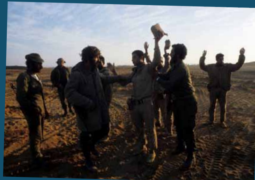
Ägyptische Soldaten nehmen Israelis gefangen