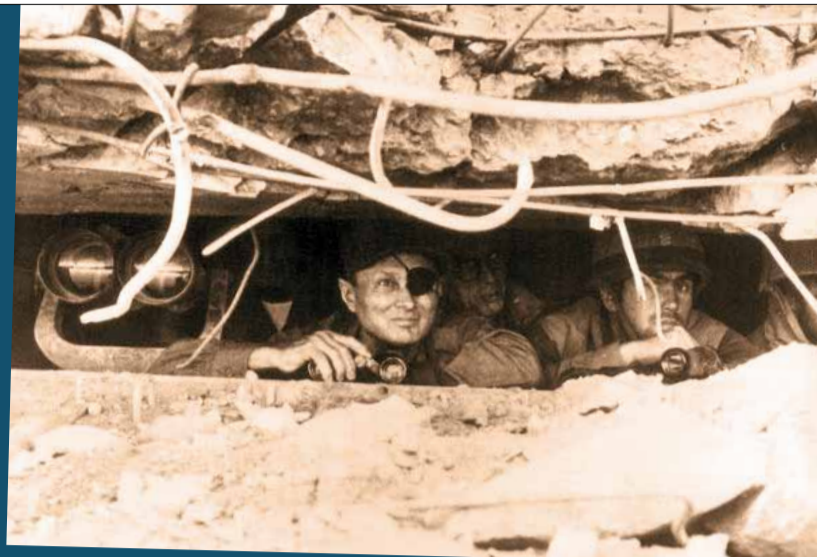
Israels Verteidigungsminister Moshe Dajan in prekärer Lage

Trotz der ebenfalls katastrophalen Lage an der Sinaifront zieht Peled sämtliche Flugzeuge von dort ab und setzt sie gegen die Syrer ein. Vom 9. Oktober an wird Syrien bombardiert. Zwei Tage später gelingt den Israelis die Wende: Mit neuen Waffen aus den USA rücken sie in Richtung Damaskus vor und stehen drei Tage später nur noch 30 Kilometer vor Syriens Hauptstadt. Die Luftwaffe hat keine Probleme mehr, da die Syrer die SAM-Raketen ausgegangen sind; die sowjetischen Nachschubflüge laufen erst an.