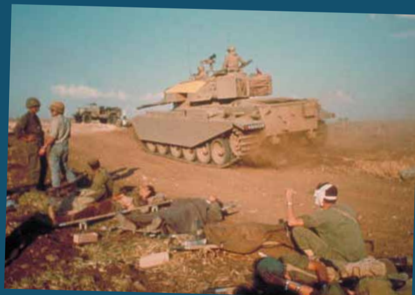
Die Gegenoffensive rollt: Israelische Panzer rücken vor